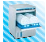
EcoStar 530 F