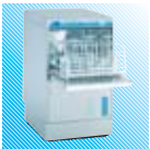
FV 28 GIO