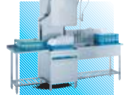
EcoStar 545 D